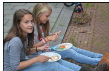
Het feest in 2014